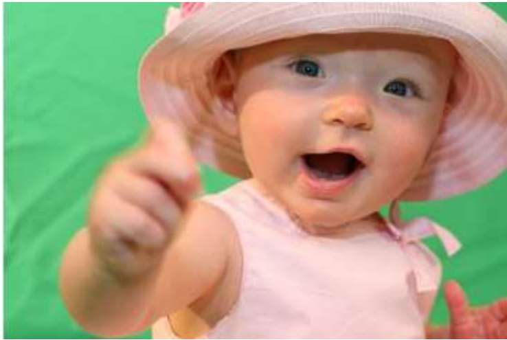
Holčička znakuje slovo mléko.